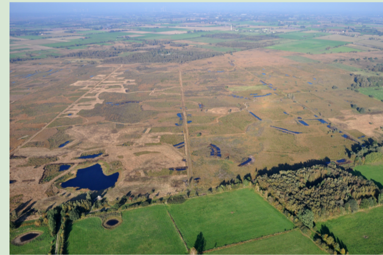
Zentralbereich des Oppenweher Moores

Das Oppenweher Moor wird durch die Landesgrenze zwischen Nordrhein-Westfalen (Kreis Minden-Lübbecke) und Niedersachsen (Landkreis Diepholz) politisch geteilt. Vögel und Pflanzen nehmen diese Grenze nicht wahr. Im Sinne des Europäischen Schutzgebietssystems NATURA 2000 arbeiten Nordrhein-Westfalen und Niedersachsen gemeinsam an der grenzübergreifenden Gebietsentwicklung.