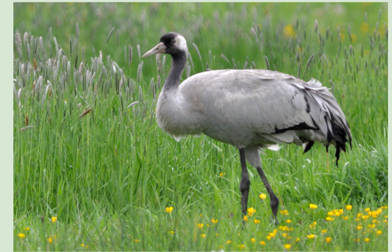
Kraniche können häufig im Umfeld der Moore beobachtet werden

Das Vogelschutz- und FFH-Gebiet „Oppenweher Moor“ weist eine beeindruckende Anzahl landesweit gefährdeter Vogelarten auf. Bekassinen haben hier den landesweit höchsten Brutbestand. Hervorzuheben sind auch die Brutvorkommen von Krickente, Raubwürger und Schwarzkehlchen. In den letzten Jahren hat sich das Gebiet zu einem bedeutenden Rastplatz für den Kranich entwickelt. Große Kranichtrupps ziehen regelmäßig im November über das Moor, ihr trompetenhafter Schrei ist unüberhörbar. Zum Höhepunkt der Rast können sich über 100.000 Kraniche in der Diepholzer Moorniederung aufhalten.