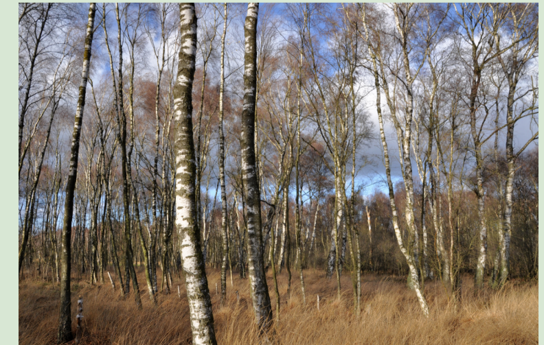
Lichter Moorbirkenwald prägt die trockeneren Randbereiche des Moores