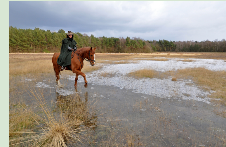
Wie mag die Frau den Weg durchs Oppenweher Moor gefunden haben?

Unterwegs setzten die Wehen ein und im Haus einer Heuerlingsfamilie kam ihr Kind zur Welt. Sie ließ es in der Obhut der Leute zurück und ritt weiter. Sie ahnte nicht wie gefährlich ihr Weg durchs Moor war. Plötzlich scheute das treue Tier vor einem auffliegenden Fasan, kam vom sicheren Weg ab und versank im grundlosen Moor. Die junge Mutter konnte sich auf festen Grund retten und musste zu Fuß weiter gehen. Aber als sie endlich in Schloss Haldem angekommen war, fand sie den Liebsten nicht mehr. Sie fand dort Unterkunft bei einer Familie und wartete. Sehnsüchtig hoffte sie auf ein Wiedersehen, wenn ein Trupp Soldaten in Haldem ankam. Vergebens. Im Jahre 1813, als sie längst wieder mit ihrem Kind im Amt Auburg lebte, kehrte ihr Verlobter aus dem Russlandfeldzug zurück. Er hatte im Krieg einen Arm verloren, doch das Leben behalten. (Diese überlieferte Geschichte wurde von Lotti Rossa nacherzählt.)