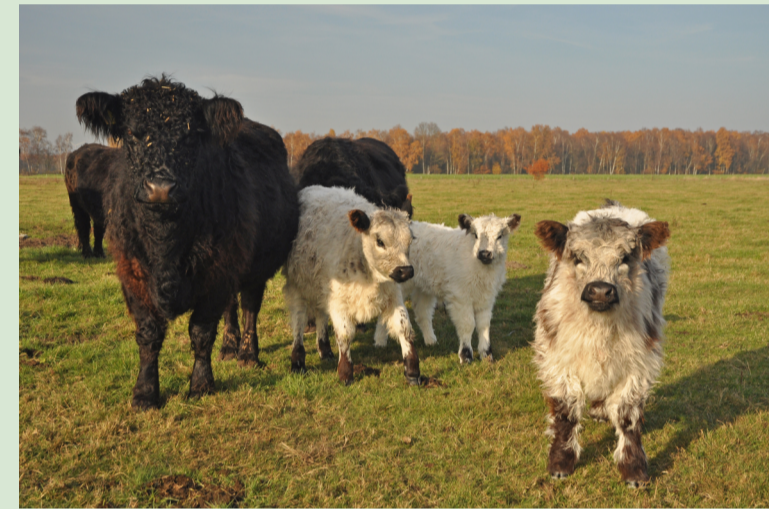
Extensive Beweidung der Feuchtwiesen mit Galloways

Der östliche Teil des Naturparks ist durch weite Moorlandschaften geprägt. Die Moore der Diepholzer Moorniederung haben für den internationalen Vogelschutz eine besondere Bedeutung. Tausende von Kranichen, Gänsen und Wiesenvögeln machen hier Rast. Vor allem in den frühen Morgenstunden und zum Sonnenuntergang erwartet Besucherinnen und Besucher ein einzigartiges Naturschauspiel, wenn die „Vögel des Glücks“ aus ihren Gebieten aufsteigen bzw. in sie einfliegen.