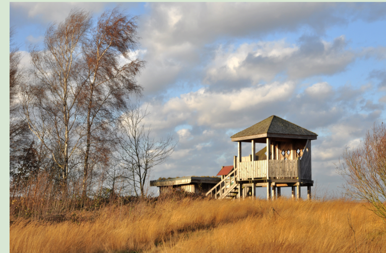
Vogelbeobachtungsstand am Südrand des Moores

Rundweg V: Ein 2,4 km Rundweg führt im trockeneren Randbereich des Moores durch offenes Grünland und kleine Moorbirkenwäldchen.